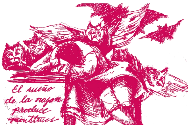
Version trazada de "El sueño de la razón produce monstruos" Grabado al aguatinta 43/80 de la serie Los Caprichos de Francisco Goya, 1799

Para afiliarte: http://ancaba.net/quieres-afiliarte/